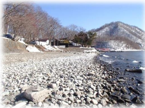
3月20日支笏湖温泉・ヒメマス広場より 11月頃にはヒメマス(ベニザケの湖沼残留型)の親魚がこの場所を泳ぎます

年間湖の水位が一番低いのがこの時期ですが、今年はさらに下がっています。この辺りで長年暮らしている方も驚くほどで、いつもは水に沈んでいる古い防波堤が湖面から顔を出している、当時を懐かしく思う方もいるようです。3月の降水量が極端に少なかったことが水位の低い理由と想われます。 知らない人は比べようがありませんが季節が巡って再度訪れた際、水位の違いがはっきりと見て取れますのでこの時期に湖岸を歩いてみてはいかがでしょうか。 広々とした湖岸で、のんびり過ごすのはとても良いものです。湖上を吹きぬける春の風を受けながら残雪の山並みを眺めたり、岸辺の土から顔を出すふきのとうの花(※アキタブキ)や野草の小さな芽吹きに目をやったりして春の訪れを実感するのもいいものです。(注・水位が低い状態は4月下旬まで、それ以降は雪解け水が集まるので水が増していきます。)