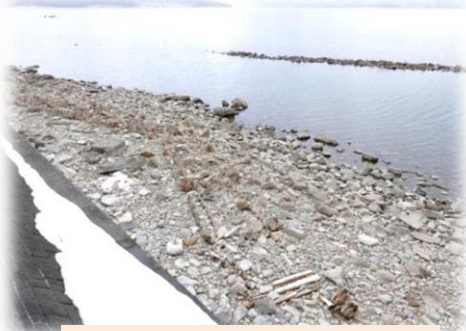
沖には防波堤の跡が見えています

年間湖の水位が一番低いのがこの時期ですが、今年はさらに下がっています。この辺りで長年暮らしている方も驚くほどで、いつもは水に沈んでいる古い防波堤が湖面から顔を出している、当時を懐かしく思う方もいるようです。3月の降水量が極端に少なかったことが水位の低い理由と想われます。 知らない人は比べようがありませんが季節が巡って再度訪れた際、水位の違いがはっきりと見て取れますのでこの時期に湖岸を歩いてみてはいかがでしょうか。 広々とした湖岸で、のんびり過ごすのはとても良いものです。湖上を吹きぬける春の風を受けながら残雪の山並みを眺めたり、岸辺の土から顔を出すふきのとうの花(※アキタブキ)や野草の小さな芽吹きに目をやったりして春の訪れを実感するのもいいものです。(注・水位が低い状態は4月下旬まで、それ以降は雪解け水が集まるので水が増していきます。)